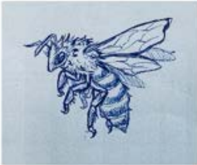
Zeichnung: Jasmin Ben Djemaa (8b)